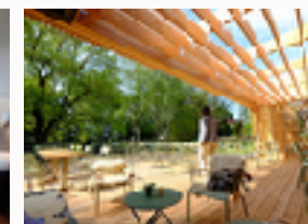
Terrasse und Garten