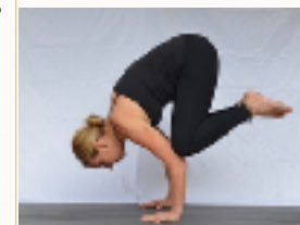
„Bakasana“ , die Krähe