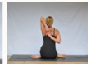
„Gomukhasana“, das Kuhgesicht